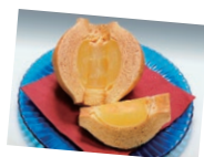
やいたの アップルクーヘン