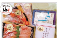
やいた地鶏 美しやも