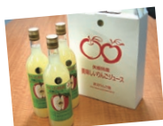
やいた特産 完熟りんごジュース