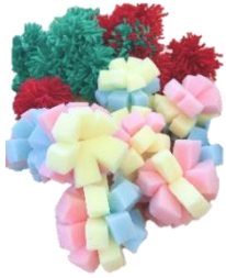
▲おもちゃは全部、身近な素材 で作っています。