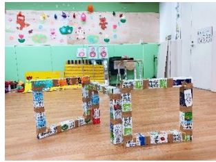
▲折りたたみ式牛乳パックトンネル。 どんな遊びに発展するかは、 当日のお楽しみ♡