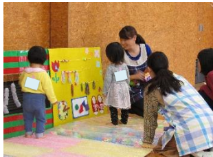
▲昨年度の様子。 「どれが、きになるかな？」