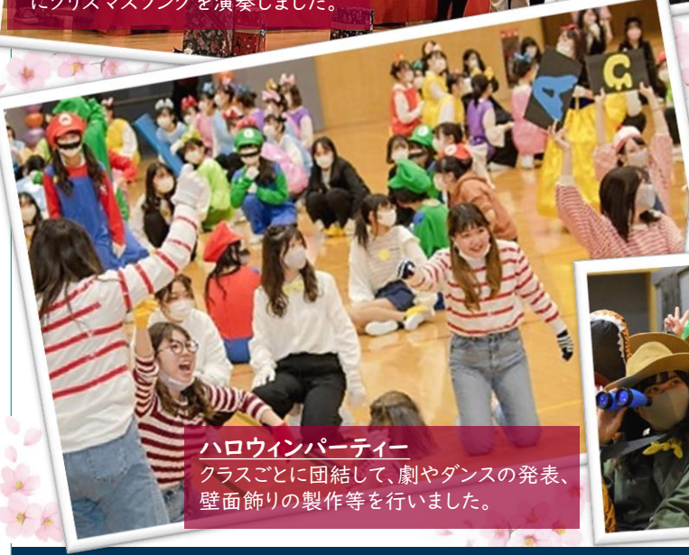
ハロウィンパーティー クラスごとに団結して、劇やダンスの発表、壁面飾りの製作等を行いました。