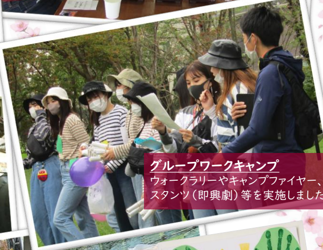
グループワークキャンプ ウォークラリーやキャンプファイヤー、スタンツ(即興劇)等を実施しました。