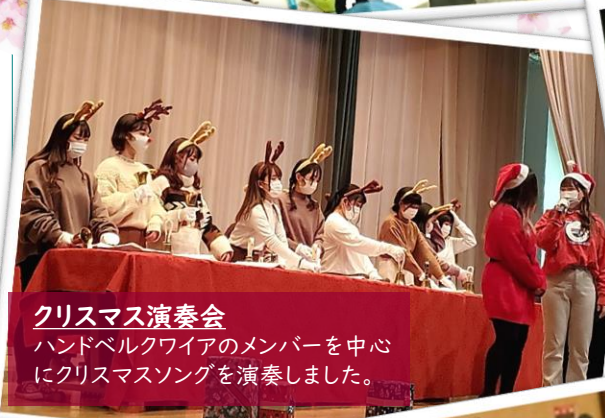
クリスマス演奏会 ハンドベルクワイアのメンバーを中心にクリスマスソングを演奏しました。