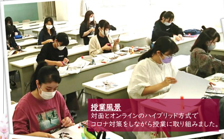
授業風景 対面とオンラインのハイブリッド方式でコロナ対策をしながら授業に取り組みました。