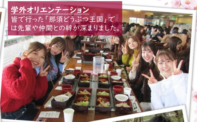
学外オリエンテーション 皆で行った「那須どうぶつ王国」では先輩や仲間との絆が深まりました。