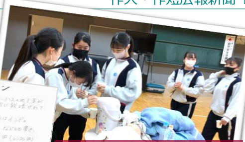
赤十字幼児安全法短期講習会 ホットタオル作り体験等、災害時の乳幼児支援について学びました。