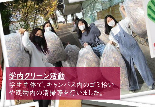
学内クリーン活動 学生主体で、キャンパス内のゴミ拾いや建物内の清掃等を行いました。